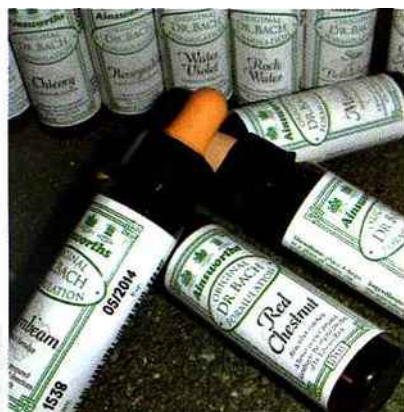
Les fleurs de Bach se vendent en flacon de 10 ou 20 ml et doivent ensuite être diluées.

- Un de vos furets se montre agressif envers les autres ? Il faut tenter de savoir pourquoi. Est-ce de la jalousie ? De l'intolérance ? Ou de la dominance excessive ? Observez votre compagnon pour le savoir. Si vous ne parvenez pas à cerner le problème, donnez les trois fleurs.